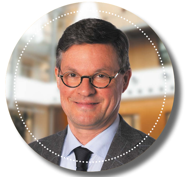
Burgemeester Bas van den Tillaar

“In eerste instantie hoop ik dat de bezoekers – al genie-